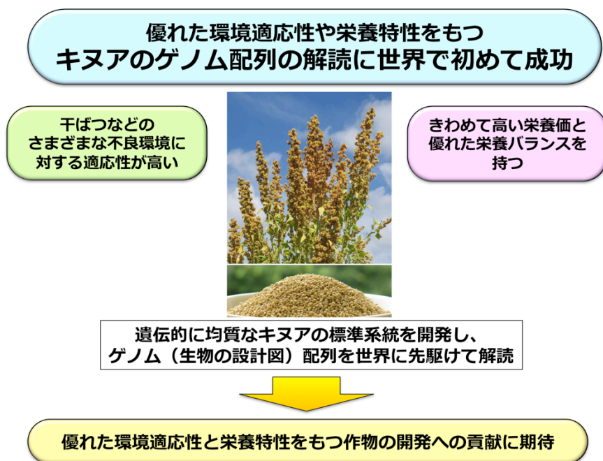
図 3. キヌアのゲノム解読が切り拓く新たな作物改良への展開

キヌア遺伝子とヒユ科近縁種（テンサイ、ホウレンソウおよびアマランサス）およびモデル植物のシロイヌナズナの遺伝子を比較しました。各区分において、数字は類似の遺伝子をまとめたグループの数を示します。また、括弧内の数字はそのグループに属する遺伝子の数を示します。5 種類の植物すべてに共通する遺伝子グループは、3,342 種でした（図の中心の区分）。キヌアだけにみられる遺伝子は 13,320 種でした（図の左上の区分）。